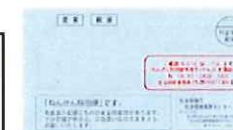
3月までの青色の封筒